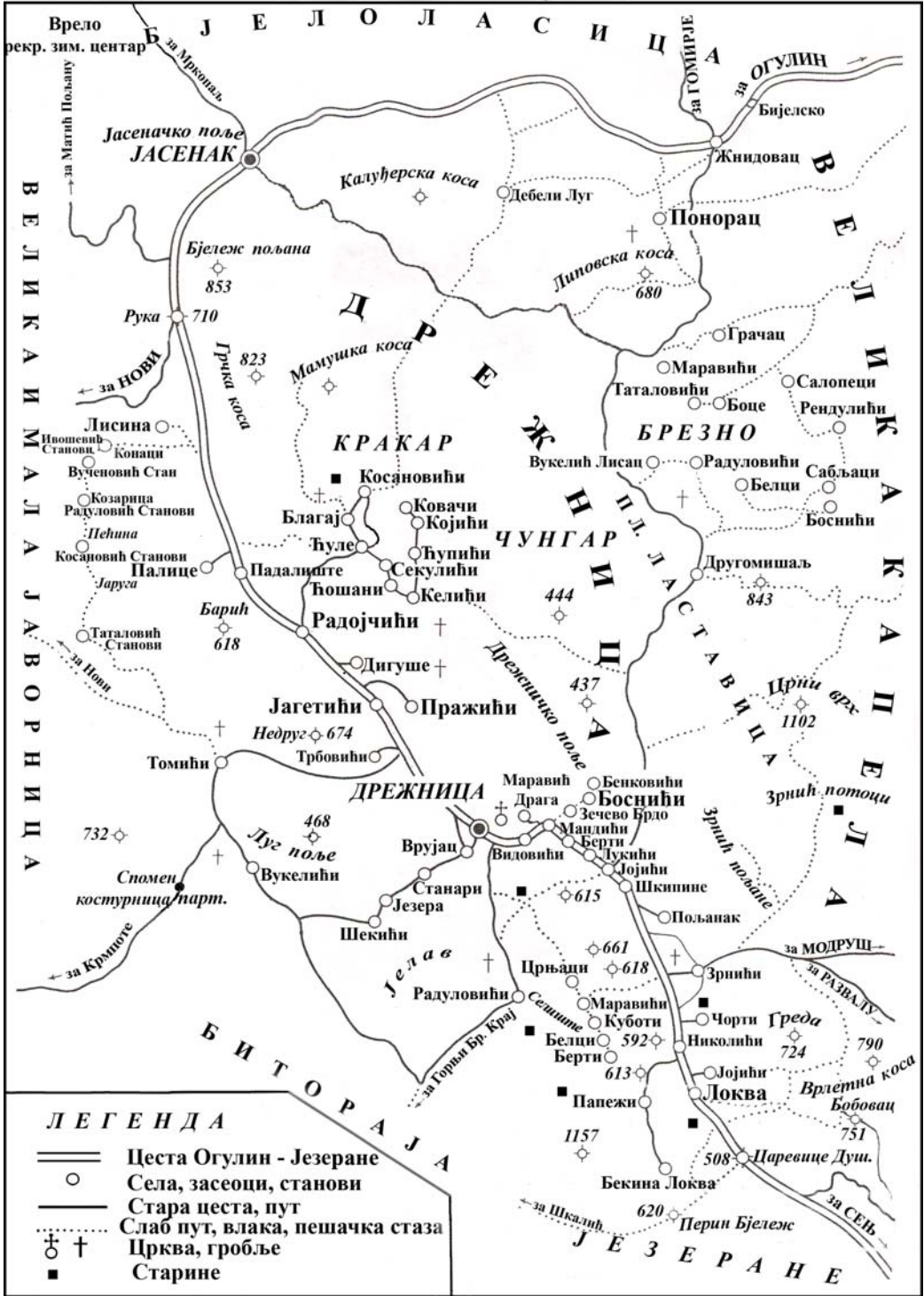
Сл. 3. – Карта насеља Дрежнице (према цртежу М. Вукотић, допуњено и прерађено)